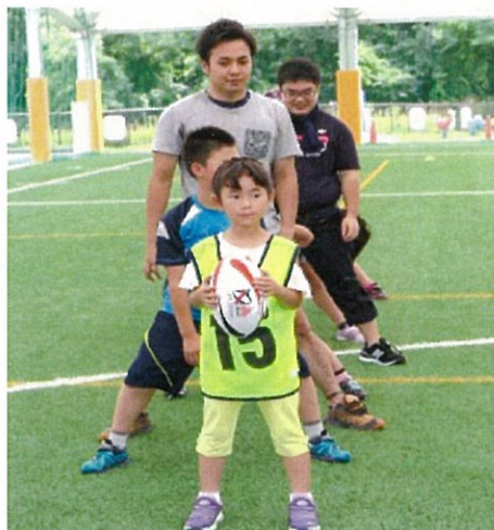
↓たくさんのお友達が参加しました！

子供や初心者、レクリエーション向けの簡易ラグビー。タックルなどの激しい身体接触を腰の両脇に付けた帯状の布(タグ)に置き換え、ボールを持った者がタグを取られるとパスしなければなりません。