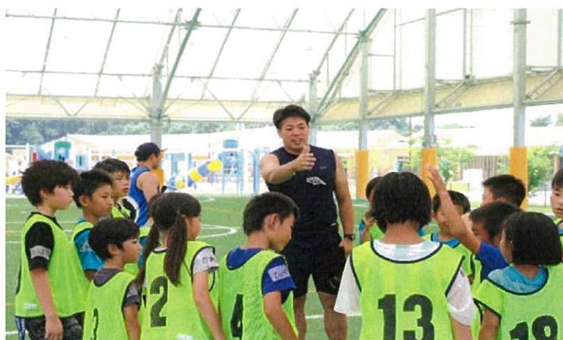
↑コミュニケーションをとりながらのしくワイワイと！