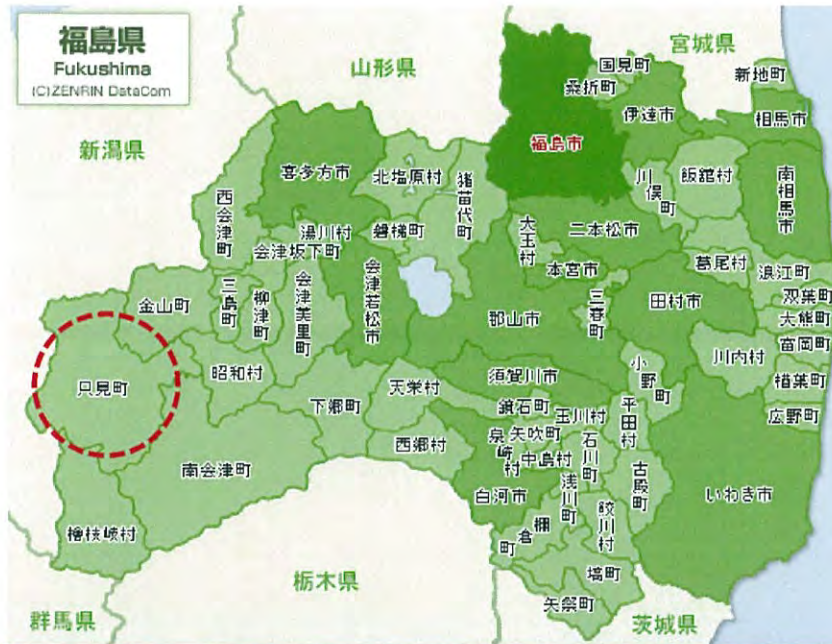
↑南会津郡に属し、新潟県に隣接する只見町