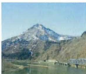
自然豊かな只見町

只見町は周囲を森林に囲まれた日本でも有数の豪雪地帯で、豊かな自然環境から2014年に『ユネスコエコパーク』に認定され、環境の保護と文化継承、地域活性化のモデルとしてさまざまな活動に取り組んでいます。