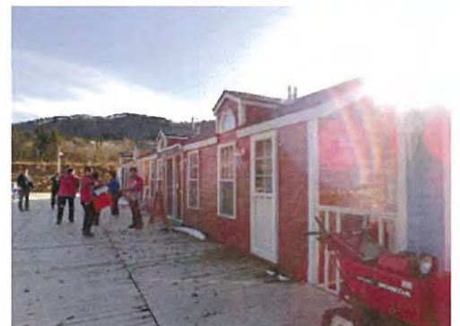
カフェが併設されているクラブハウス