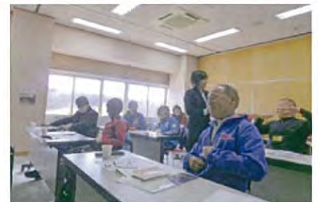
2020年東京オリンピック

新聞・ホームページなどでボランティアの活躍をアピールして、社会的地位の向上を目指しましょう！