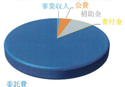
平成29年度活動費の内訳

スタートアップビーチバレー：常設のビーチバレーコートにて、ビーチバレーの技術の習得と人口交流を図ります。 TADAMI スノースポーツフェスティバル：雪上バレー・雪上フットサル競技を通じて、地域資源である雪を利用して、多世代、他地域との交流と地域活性化を目指します。