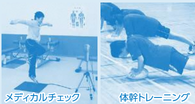
メディカルチェック

クロストレーニングに選抜された6年生は、次年度からの3年間、さらに専門的なトレーニングやメディカルチェック(医学的サポート)を受けることで、アスリートへのステップアップをめざします。