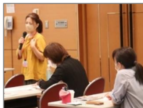
〈活動状況報告の様子〉