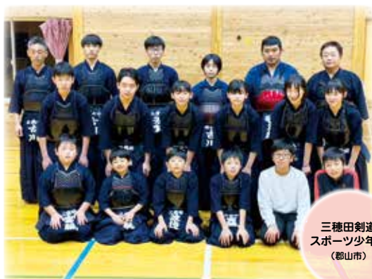
三種田剣道 スポーツ少年団 (郡山市)