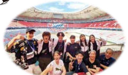
2006年Wカップ会場FC バイエルンミュンヘンホームスタジアム