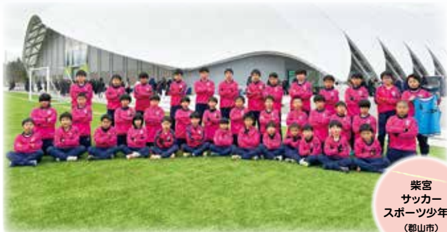
柴宮 サッカー スポーツ少年団 (郡山市)