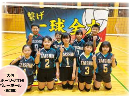
大信 スポーツ少年団 バレーボール (白河市)