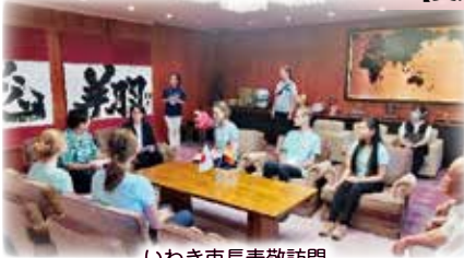
いわき市長表敬訪問