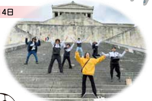
ドナウ川岸 ヴァルハラ神殿