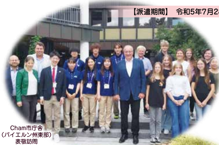
Cham市庁舎 (バイエルン州東部) 表敬訪問