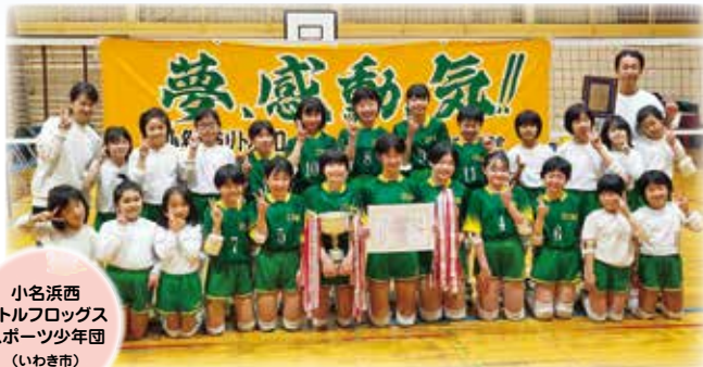
小名浜西 リトルフロックス スポーツ少年団 (いわき市)