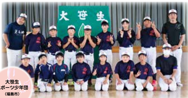
大笹生 スポーツ少年団 (福島市)