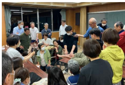
【テーピングによる応急処置】